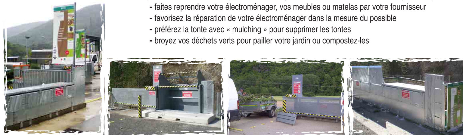
Sept déchèteries ont été rénovées en 2014 : Aumont Aubrac, Florac, Le Maizieux, Le Pont de Montvert, St Alban sur Limagnole, St Chély d'Apcher et Ste Enimie. Pour 2015, les travaux se terminent à la déchèterie du Valdonnez et les études de Ste Croix Vallée Française et de Villefort sont en cours.